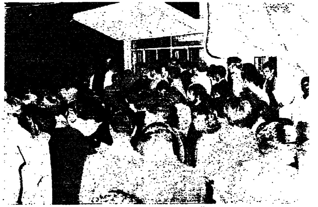
لقطة أخرى للتجمع الذي شهدته «الدستور» أمس والذي ضم طلاب مسكر العمل الدولي والسر الأريانية التي استضافتهم للمساءلة